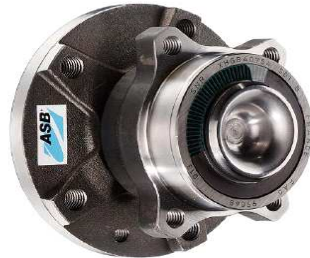
XHGB 40754 S01